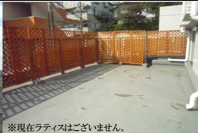
※現在ラティスはございません。