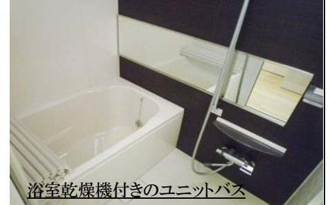
浴室乾燥機付きのユニットバス