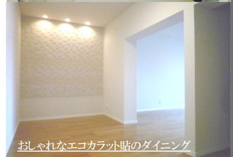
おしゃれなエコカラット貼のダイニング