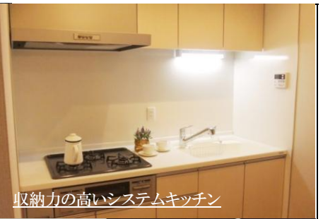
収納力の高いシステムキッチン