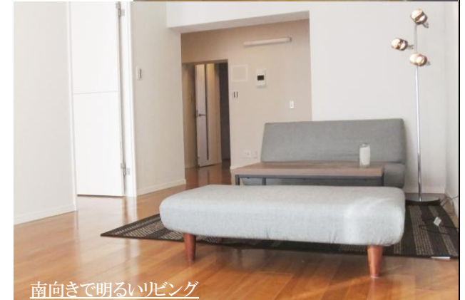
南向きで明るいリビング