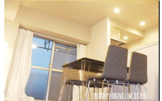
実際の部屋(家具付)