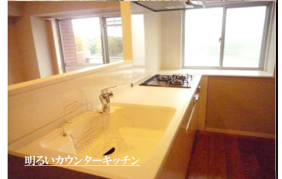
明るいカウンターキッチン