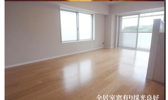
全居室窓有り採光良好